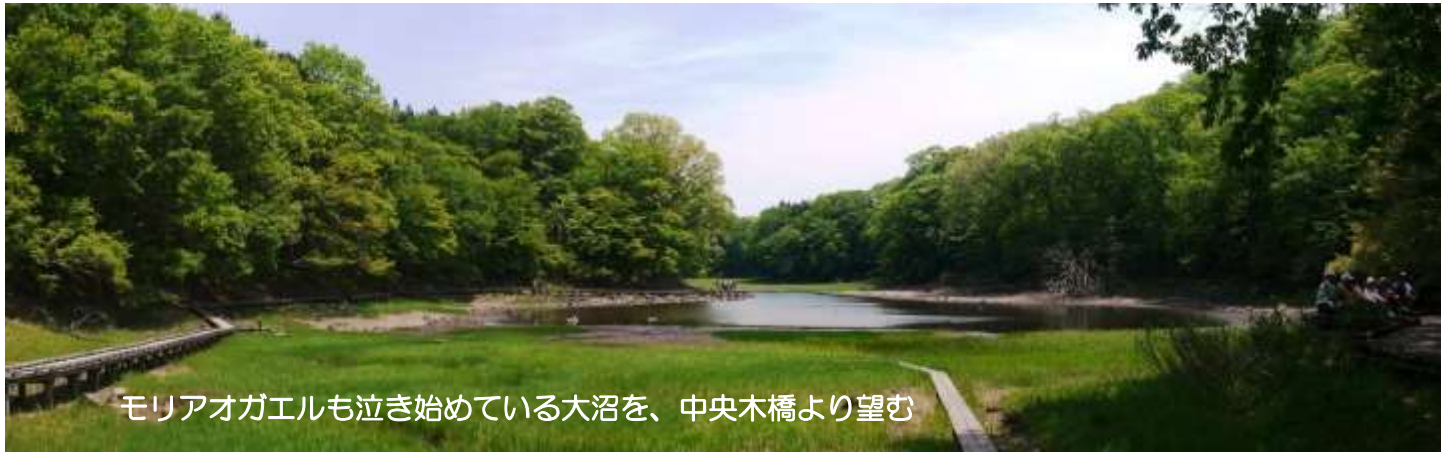
モリアオガエルも泣き始めている大沼を、中央木橋より望む