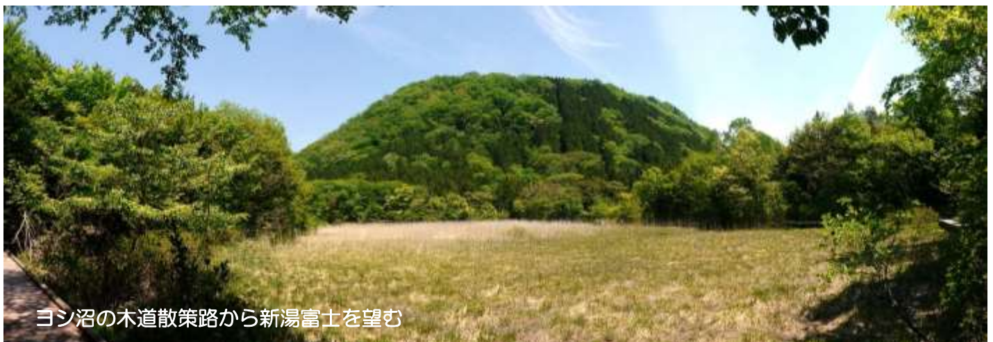
ヨシ沼の木道散策路から新湯富士を望む