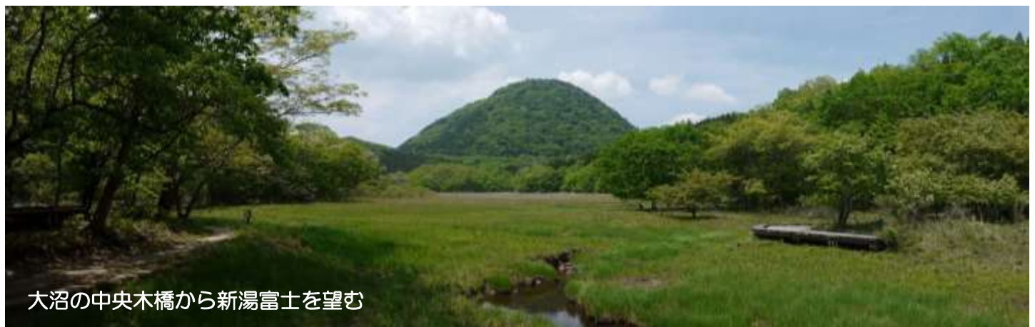
大沼の中央木橋から新湯富士を望む