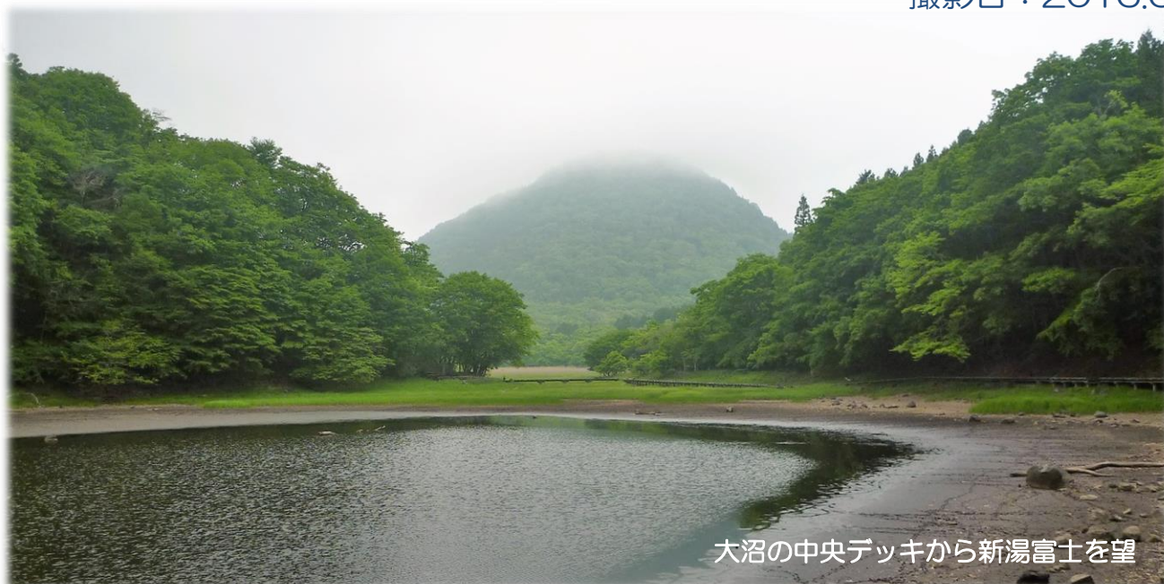
大沼の中央デッキから新湯富士を望