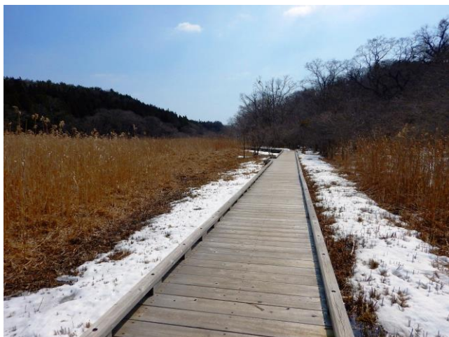
大沼公園散策路木道などには、まだ残雪が残る箇所があります。