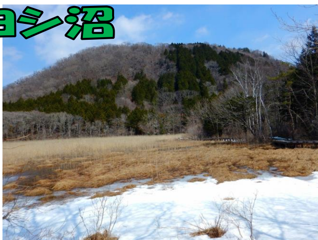
散策路より新湯富士を望む