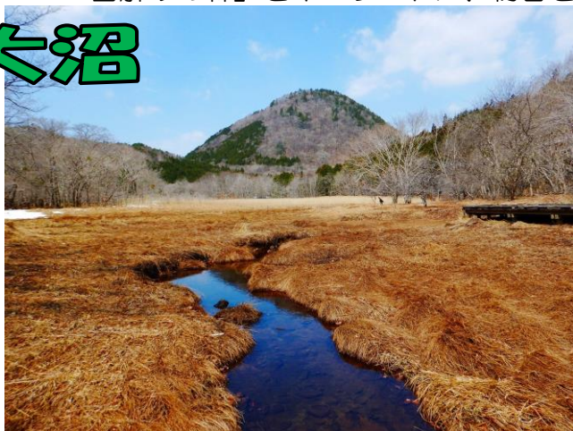
散策路「中央木橋」より新湯富士を望む