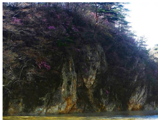
箒川溪谷鹿股川合流地点付近 (塩釜地区)