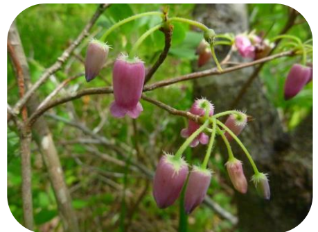
ウラジロヨウラク