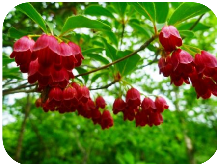
ベニサラサドウダン