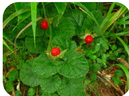
マルバユフイチゴ (果実)

〈「自然公園利用マナー」を守り楽しく自然散策！〉 ※自然散策・観察する時は、許可なく散策路・木道から降りたり、 動植物の採取などの行為は禁止です。ごみは持ち帰りましょう。